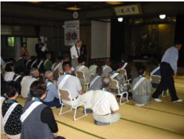
同朋会館にて 法名伝達式