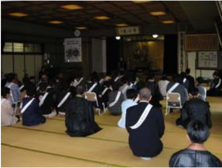
11時20分 同朋会館三階の講堂で の結成式