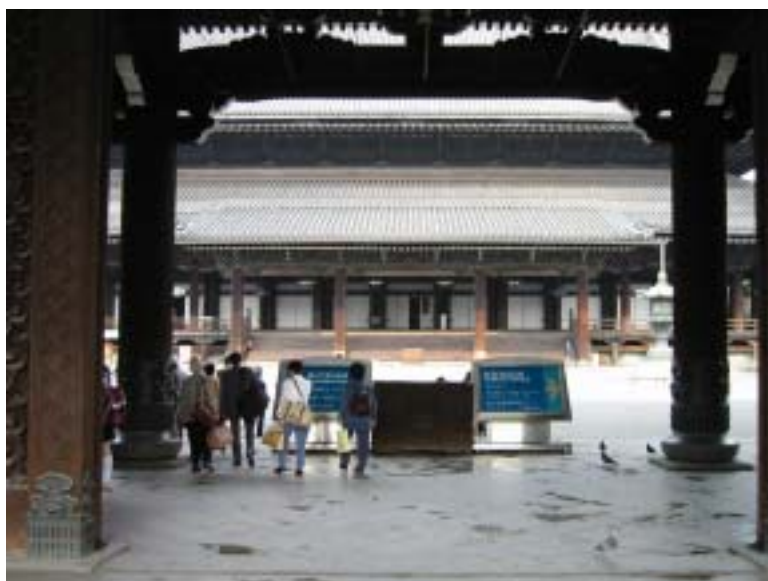
真宗本廟到着 こえいどうもん 御影堂門より入る。 こえいどう 正面は御影堂