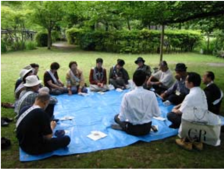
2日目午後 清掃奉仕は渉成園(枳殻邸) の草とりをしました。 終わってからの座談会