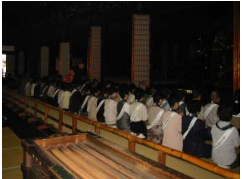
2日目 晨朝参拝後の きぎょうしき 帰敬式(おかみそり) ごえいどう 御影堂