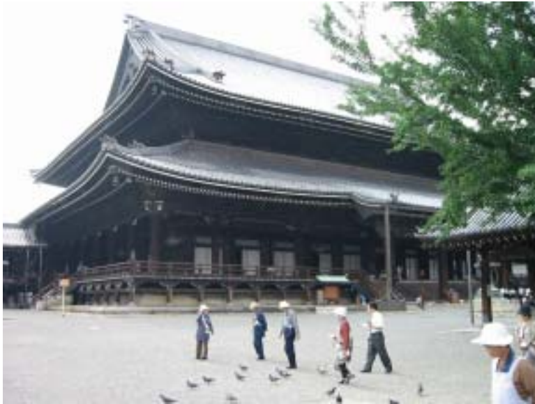
きこくてい 枳殻邸の清掃奉仕を終わって同朋会館に帰るところ