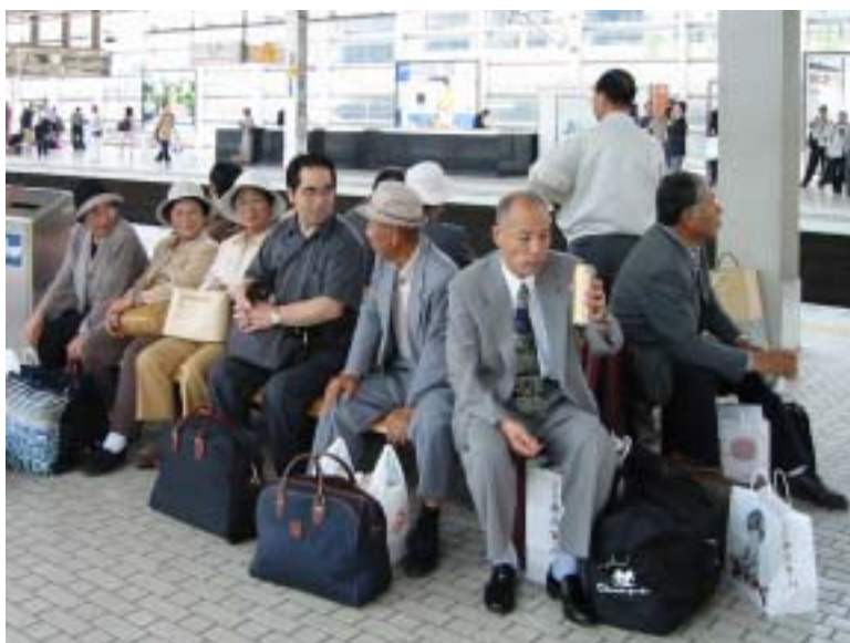
京都駅新幹線ホーム