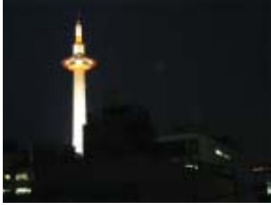
同朋会館の部屋より 撮影した京都タワー