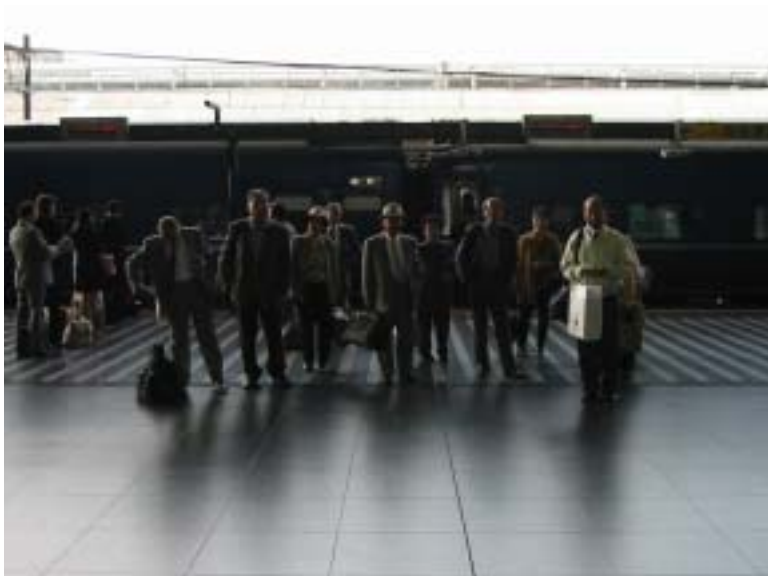
6月1日 7時52分 京都駅 後ろは乗ってきた彗星