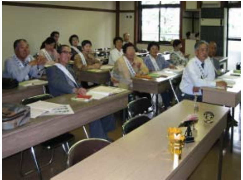
午後からの お内仏のお給仕